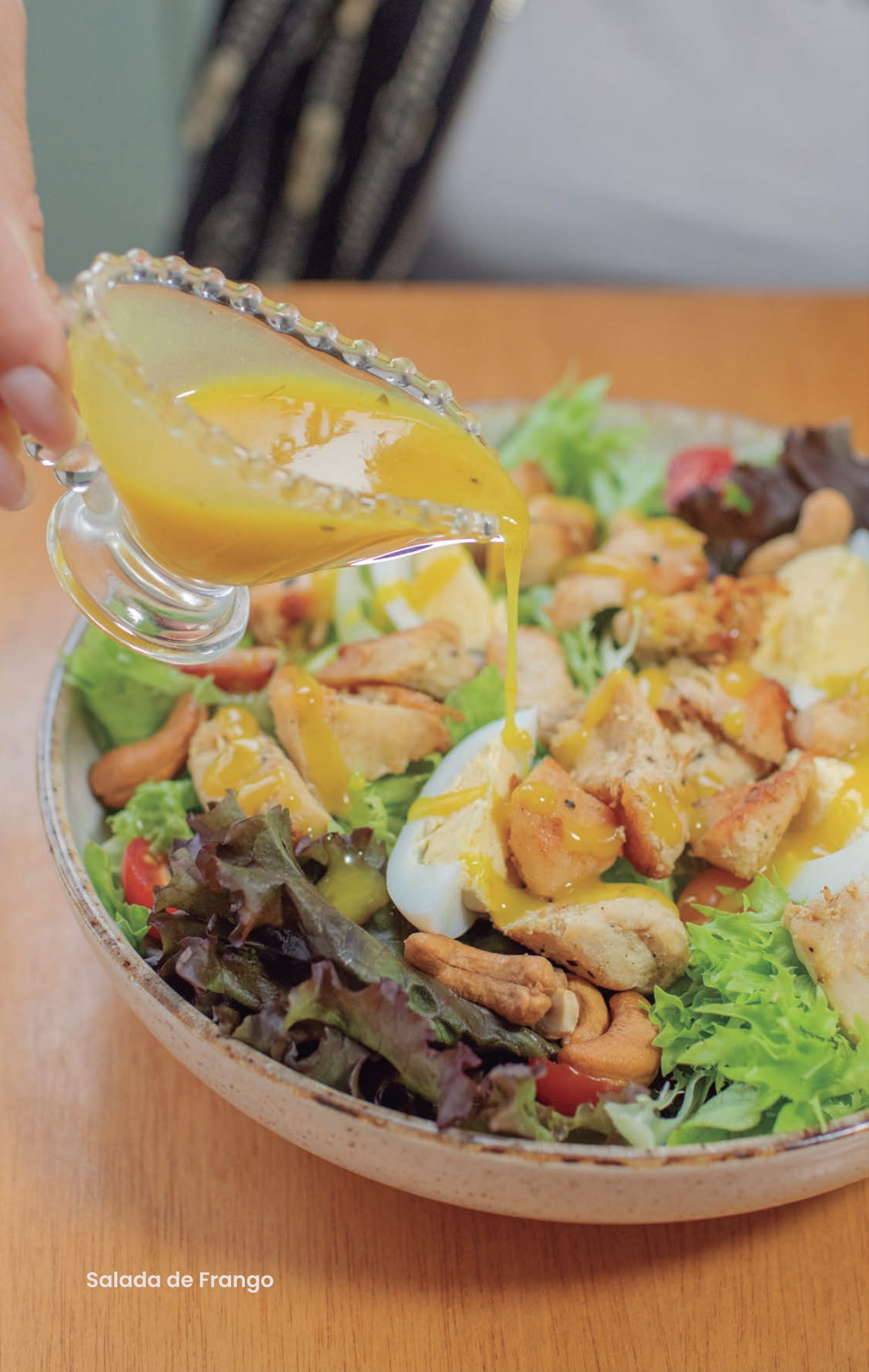
Salada de Frango