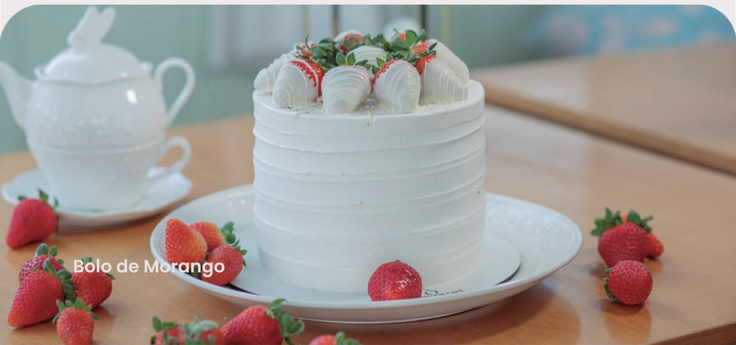
Bolo de Morango

Servido com calda de brigadeiro cremoso e confeito de chocolate.