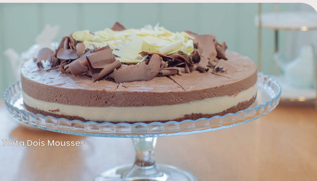
Torta Dois Mousses

Base sucrée com creme de coco fresco, abacaxi, nata e massa folhada em pedaços