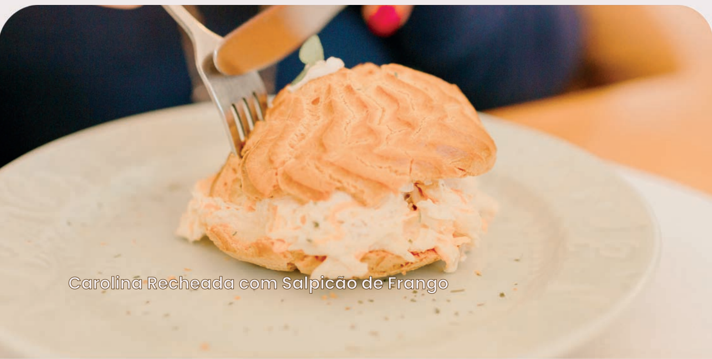
Carolina Recheada com Salpicão de Frango

Patê à choux recheada com frango desfiado, cenoura, maionese e cheiro verde.