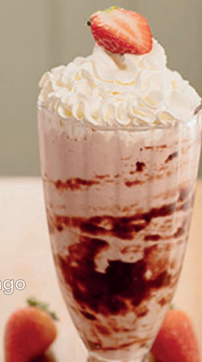
Milkshake de Morango