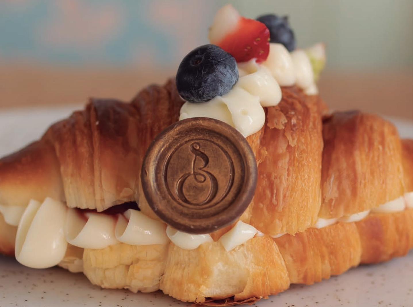
Croissant de Creme Belga com Frutas Vermelhas